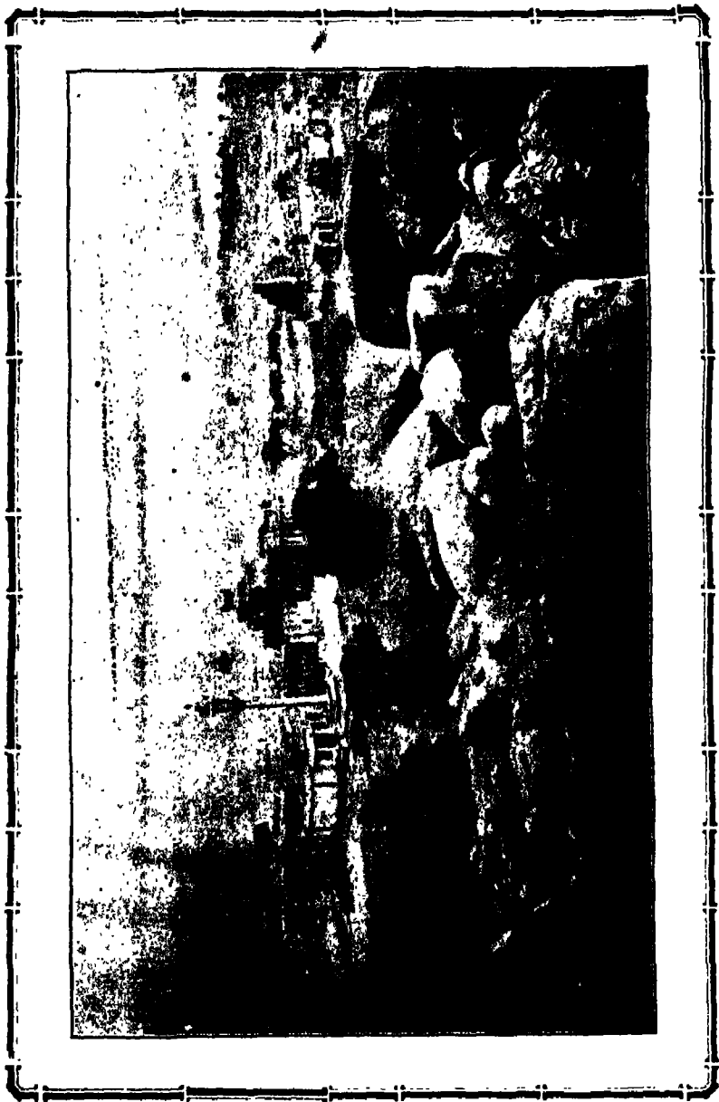
राष्ट्रकुटाराजा इन्द्र चतुर्थका समाधिस्थान—चन्द्रगिरि पर्वत, श्रवणबेलगोला ।